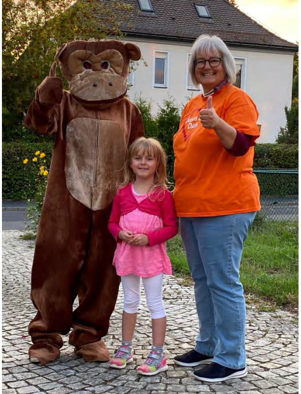
Bei einem Kurzbesuch des Affen

In den Videoclips war der Affe gerade für die kleinen Teilnehmer eine Schlüsselfigur. Fast alle wollten wissen, wer sich in dem Kostüm versteckte.