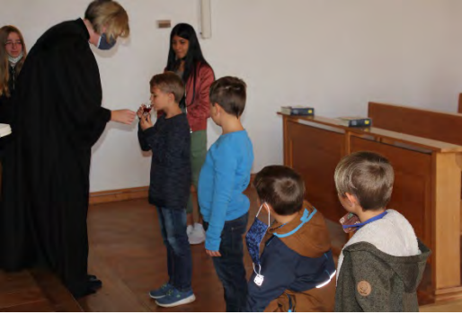
... in der Friedenskirche in Waldsassen.