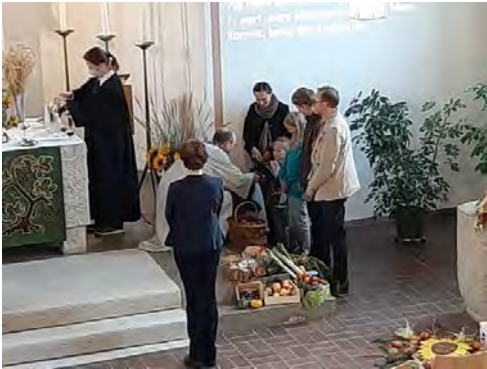
... in der Erlöserkirche in Tirschenreuth.

Im Sakrament des Heiligen Abendmahls ist Christus gegenwärtig. Durch, mit und im Brot und der Frucht des Weinstocks kommt er zu uns und stärkt uns.