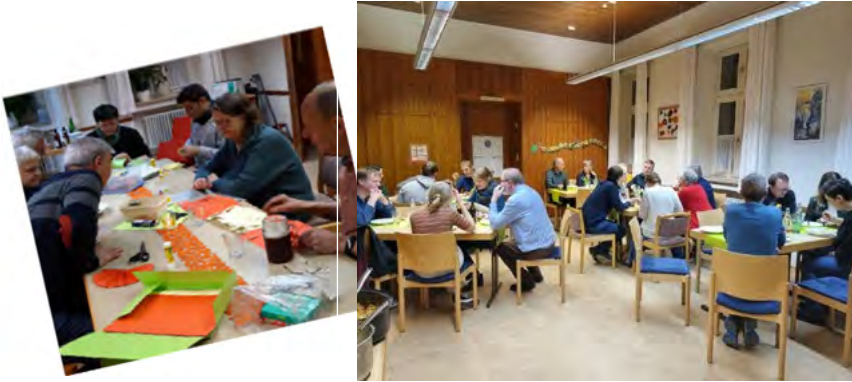
Foto: Basteln von Faschingsgirlanden im Februar und Endlich Freitag mit Geburtstagsfeier im März